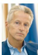
Riccardo Illy 2004-2008